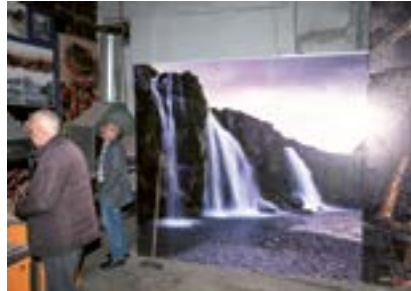
Mangal ve Şelale, Diyarbakır, 2021 Bir kebabçının avlusunda müşteriler.