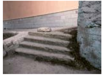
Ulus'ta Merdiven, Ankara, 2021 Ուլուսի մէջ սանդուղներ, Անգարա, 2021