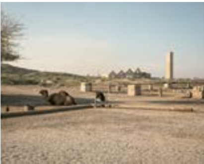
Harran, Güneydoğu Anadolu, 2022

Antik Harran bölgesi, uzakta yeniden inşa edilmiş yıkıntılar ve çevrede deve gezintisi yaptırmak için turist bekleyen bir adam.