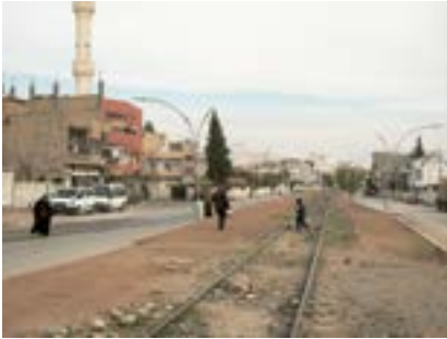
Nusaybin'deki Berlin-Bağdat Demiryolu, Güneydoğu Anadolu, 2021

Suriye sınırına yakın Nusaybin'de Berlin-Bağdat demiryolunun kullanılmayan rayları. Berlin-Bağdat demiryolu inşaatı 20. yüzyılın başlarında başladı, imtiyaz bir Alman banka sendikasına verildi ve ana sponsorlardan biri Alman hükümetiydi. Berlin'i Basra Körfezi'ne bağlayacak bir demiryolu, Almanya'ya Afrika'daki en güneydeki sömürgeleriyle bağlantı sağlayacak ve bölgedeki güç dengesini büyük ölçüde değiştirecekti. Demiryolu hiçbir zaman tam olarak bitirilemedi ve mahmuzlardan biri Nusaybin'de son buldu. Demiryolu 1915'ten itibaren yüzbinlerce Ermeni'yi tehcir etmek için kullanıldı ve ardından Suriye Çölü'ne doğru ölüm yürüyüşlerine çıkarıldılar.