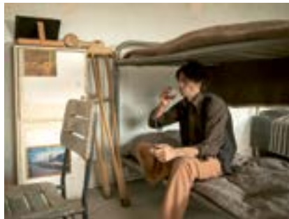
Ulucanlar Mahkumu, Ankara, 2020

Ulucanlar Cezaevi Müzesi'nde bir mahpus sahnesi sunumu.