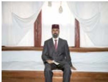
Mehmet Akif Ersoy, Ankara, 2021

Ey inananlar, bilin ki İslam'da millet yoktur. Yüce Peygamberimiz ve Rabbimiz buyurdu ki: 'Kabilelere bölünenler bizden değildir.' Kiminiz Araplığınızı, kiminiz Arnavutluğunu, kiminiz Türklüğünü, kiminiz Kürtlüğünü