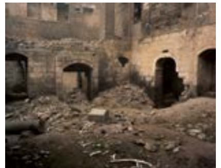
Surp Sarkis Yıkıntıları, Diyarbakır, 2022

1915 yılında el konulan*, uzun süre çeltik fabrikası ve ambarı olarak kullanılan Sur'daki Ermeni kilisesi Surp Sarkis'in içi. 16. yüzyılda yapıldığı düşünülen kilisenin yaklaşık yüzde 70'i yıllar içinde yıkılmış. 6 Aralık 2019'daki