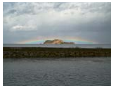
Ahtamar Gökkuşağı, Doğu Anadolu, 2018