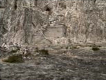
Eski Van, Doğu Anadolu, 2018

Eski Van şehri kalıntıları. Van'ın tarihi, Urartu Krallığı'nın başkenti olduğu M.Ö. 900 yıllarına kadar gitmektedir, merkezdeki devasa yapı bu döneme aittir. Urartuların Ermenilerin ataları olduğuna inanılıyor. 1915'te Van Gölü çevresindeki Ermeni köylerinde tehcir ve cinayetler başladığında, şehrin Ermeni mahalleleri, yakındaki Rus birlikleri tarafından kurtarılmaya çalışıldı. Osmanlı ordusuna karşı silahlı bir ayaklanma kararı aldı. Ruslar sonunda Van'ın Ermeni savunucularını kurtardı ve 21 Mayıs'ta kasabanın anahtarı Rus General Yudenich'e teslim edildi. Ağustos ayında Rus ordusuna karşı kazanılan bir zafer, Osmanlı ordusunun Van'ı geri almasını sağladı. Eylül 1915'te Ruslar, Türkleri ikinci kez Van'dan çıkardı. Rusya'daki Ekim Devrimi'nden sonra Rus kuvvetleri bölgeyi terk etmeye başladı ve Nisan 1918'de Osmanlı ordusu tarafından yeniden ele geçirildi. Tüm çatışmaların sonunda eski Van şehri boşalmış ve harabeye dönmüştü; Ermeni halktan yaklaşık 35.000 kişi ya öldürüldü ya da geri çekildi.