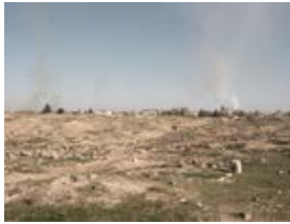
Harran'da Yıkıntılı Arazi, Güneydoğu Anadolu, 2022

Harran, MÖ 25. ve 20. yüzyıllar arasında, muhtemelen Uru Sümerli tüccarlar tarafından bir ticaret kolonisi olarak kuruldu. İnsanlık tarihinin belgelenmiş en uzun yerleşim yeridir. Erken dönem tarihi boyunca Harran hızla Mezopotamya'nın önemli bir kültürel, ticari ve dinî merkezi haline geldi. Ay tanrısı Sin ile ilişkilendirilmesi, onu dinî ve politik olarak etkili bir şehir yaptı; birçok önde gelen Mezopotamya hükümdarı, Harran'daki Ekhulkul'un ay tapınağına danıştı, yapıyı renove etti. Daha sonra Roma İmparatorluğu'nun en kötü savaş yenilgisinin yeri oldu. Ortaçağ'da Harran Muharebesi'nde komşu Haçlı devletleri Selçuklulara yenilmiştir.