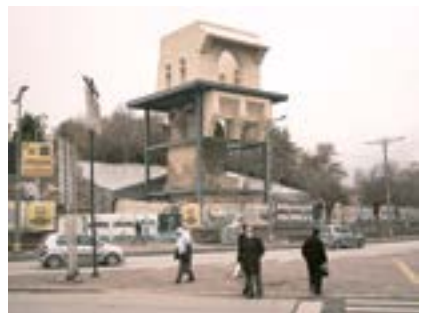
Selçuklu Sarayı, Konya, 2022 Սելճուկեան ապարանք, Քօնիա, 2022