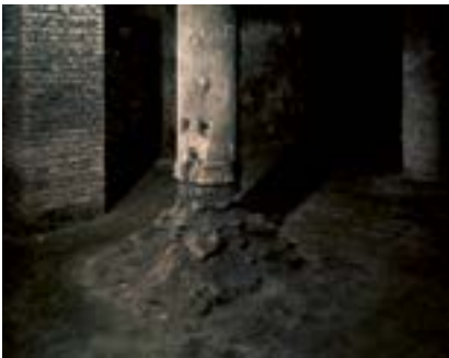
Gizli Geçit, İstanbul, 2018

İstanbul'da bir okulun bodrum katında Roma sütunları ve Bizans döneminden