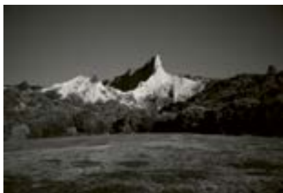
Anzak Koyu, Türkiye, 2018

Avustralya ve Yeni Zelanda Kolordusu (ANZAC), 25 Nisan 1915'te Gelibolu müttefik çıkarmaları sırasında buraya çıktı. Operasyon bir felakete dönüştü ve Birinci Dünya Savaşı'ndaki en büyük müttefik yenilgilerinden biri haline geldi.