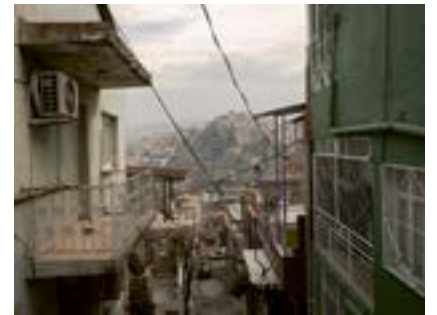
İzmir Atatürk Maskı, İzmir, 2021

Atatürk Maskı, Mustafa Kemal Atatürk'ün başının büyük bir beton rölyefidir. Anıtsal portre baş, İzmir'in tarihî kalesi Kadifekale'nin güneyinde yer alır ve 2009 yılında tamamlanmıştır. Heykeltıraşı Harun Atalayman'dır. 42 m yüksekliğindeki Atatürk Maskı, Türkiye'nin en uzun heykeli ve dünyanın en yüksek onuncu kabartma heykeli olarak kabul ediliyor. Bir iskele üzerine inşa edilmiştir, dağ yamacına oyulmamıştır. Anıt, uzay çatı sistem içeren çelik bir yapıdır. Heykelin sol alt köşesinde Atatürk'ün "Yurtta sulh cihanda sulh" sözü ve imzası rölyef olarak görülmektedir.