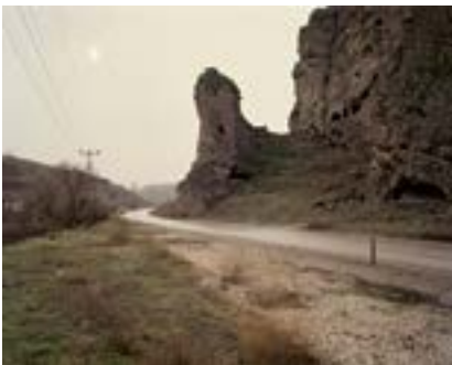
Stanoz, Türkiye, 2022

Yok olmuş Ermeni köyü Stanoz'un Ankara yakınlarındaki yeri. Köyden geriye hiçbir şey kalmamış, mezarlık