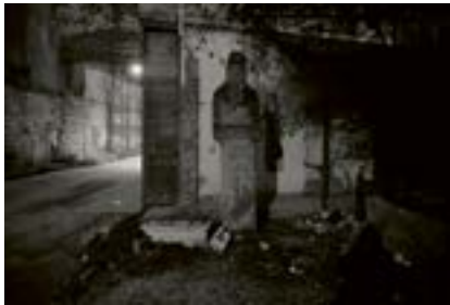
Antakya'da Heykel, Türkiye, 2021

Antakya'da Aziz Petrus Mağarası'na çıkan yol üzerinde bir antik heykel replikası. Bir zamanlar Antioch olarak anılan kent, antik çağda ve Roma döneminde ana merkezlerden biriymiş. İsa'nın takipçilerine ilk kez Antakya'da "Hiristiyan" adı verilmiş. Ortaçağ'da Haçlı devletlerinden biri olmuş.