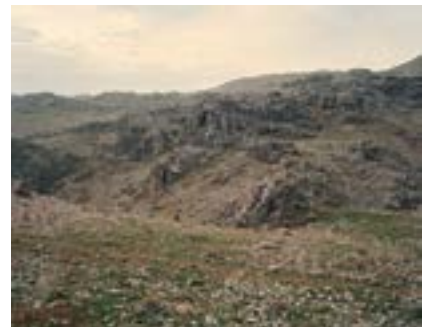
Çüngüş'te Geçit, Güneydoğu Anadolu, 2021

Çüngüş'teki bu geçide yakın bir noktada 15. yüzyıldan kalma Ermeni Surp Garabed Kilisesi'nin kalıntıları var. Kilisenin büyüklüğü, bir zamanlar Ermeni cemaatinin ne kadar kalabalık olduğu hakkında fikir veriyor.