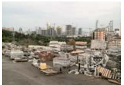
Ataşehir, İstanbul, 2018 Աթաշէհիր, Իսթանպուլ, 2018