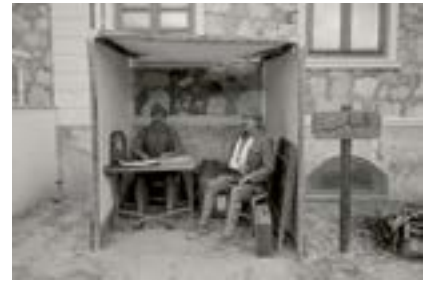
Çanakkale Şehitlik Hastane Müzesi, Türkiye, 2018

Gelibolu savaş alanlarındaki Alçıtepe "Çanakkale Şehitlik Hastane Müzesi" (Ordu Hastanesi Müzesi) içinde bir eve dönüş sahnesi.