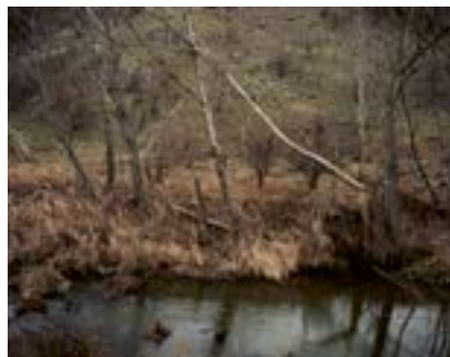
Stanoz Irmak, Türkiye, 2022

Stanoz ile ilgili en eski bilgiler, Anadolu'nun birçok yerini ziyaret etmiş iki ünlü seyyahın - Evliya Çelebi ve İngiliz kaşif William Francis Ainsworth'un kayıtlarında bulunur.