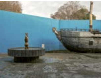
Bizans Film Seti, İstanbul, 2020

2002'de iktidara geldiğinden beri AKP, Türkiye'yi Osmanlı İmparatorluğu'nun varisi olarak sunan bir tarihselleştirme peşinde oldu. Osmanlı İmparatorluğu veya Selçuklular (örneğin Büyük Selçuklu) hakkında tarihî filmler ve TV dizileri patlama yaşıyor ve özellikle destekleniyor.