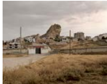
Aralez, Doğu Anadolu, 2018

Bu tuhaf gerçeküstü kayayı ilk kez, 19. yüzyıl sonu, 20. yüzyıl başına ait tarihî fotoğraflar içeren, Ermeni mirası üzerine hazırlanmış bir kitapta görmüştüm. Kayanın tepesinde bir kilise varmış, köyün ismi Aralez imiş. Kiliseden önce de burada bir pagan tapınağı varmış. Burası meşhur bir Ermeni efsanesinin geçtiği yer; Ara Keğetsig [Yakışıklı Ara] ve Semiramis'in hikâyesi. Semiramis, evli olan Ara'ya aşık olur ama o Semiramis'in aşkını reddeder. Semiramis Ara'yı öldürür. Kanatlı köpekler (Aralez) Ara'yı yalayarak canlandırır. 'Lizel', Ermenicede, 'yalamak' anlamına gelir.