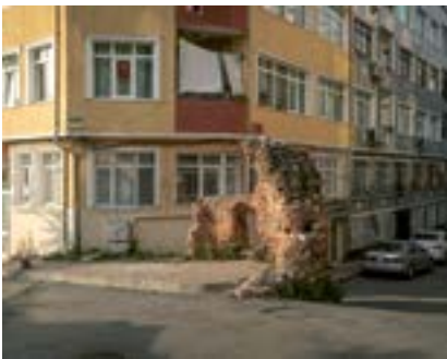
Fatih Kalıntısı, İstanbul, 2018

Fatih'te, muhtemelen Bizans-Roma döneminden bir kalıntı.