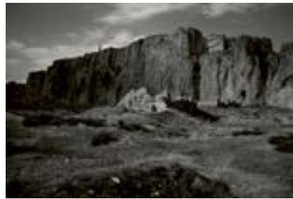
Eski Van, Doğu Anadolu, 2018

Eski Van şehri ve Van Gölü, Urartu ve Ermeni krallıklarının merkeziydi. Eski bir efsaneye göre göl, yüzeyin altında gizlenen, 9 ila 12 m uzunluğunda, kahverengi pullu bir cilde, uzun bir sürüngen kafasına ve yüzgeçlere sahip gizemli bir canavara ev sahipliği yapmış. Bazı amatör fotoğraf ve videolar dışında varlığına dair fiziksel bir kanıt yok. Tarif edilen profil, soyu tükenmiş bir Mosasaurus'u anımsatıyor.