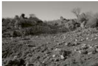
Musa Dağı, Türkiye, 2022

Antakya yakınındaki Musa Dağıճda taş duvar kalıntıları. 1915ճte zulüm ve tehcir başlayınca çevredeki Ermeni köyleri Musa Dağıճa sığındı. Eski Osmanlı subayı Movses Der Kalustyanճın organize ettiği köylüler, saldıran Türk kuvvetlerine karşı direniş yürüttüler,