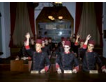
Harp Okulu, İstanbul, 2021

Harbiye Askerî Müzesi'nde bir askerî okul sınıfı sunumu.