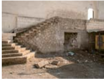
Şanlıurfa'da Merdiven, Güneydoğu Anadolu, 2022

Şanlıurfa'nın eski Ermeni mahallesindeki tarihî merdiven. 1915 tehcirine karşı girişilen silahlı direniş karşısında mahalle Osmanlı topçusu tarafından bombalanır. Zeytun Manastırı'nın yıkılmasında da rol oynamış Alman komutan* karısına şu mektubu yazar: