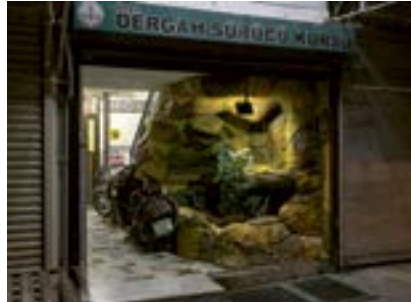
Kaya Giriş, Şanlıurfa, 2022 Ժայռի մուտքը, Շանլըուրֆա, 2022