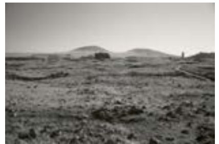
Ani, Doğu Anadolu, 2018

Ani antik kenti, ticaret kervanları için önemli bir merkezdi. Bizans, İnan, Suriye ve Orta Asya arasındaki ticaret yollarını kontrol ediyordu. Ermenistan'ın eski şehirlerinden tüccarlar ve zanaatkârlar, kırsal alanlardan gelen nüfusla birlikte Ani'ye akın etti. 992'de Ermeni Katolikosluğu merkezini Ani'ye taşıdı. 11. yüzyılın başlarında şehirde 12 piskopos, 40 keşiş ve 500 rahip bulunuyordu. Ani'nin nüfusu 100.000'in üzerindeydi, şehrin zenginlik ve prestiji o kadar büyüktü ki, "bin bir kilise şehri" olarak anılırdı. Yüzyıllar boyunca birçok fetih (Arap, Selçuklu, Bizans, Gürcü, Moğol), deprem ve yağma nedeniyle Ani düşüşe geçti. 19. yüzyılın başlarında tamamen terk edildi.