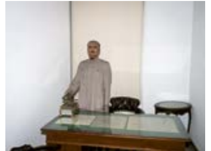
Askerî Komutan, İstanbul, 2020

Kurtuluş Savaşı'nda bir askerî komutanın Harbiye Askerî Müze'deki figürü.