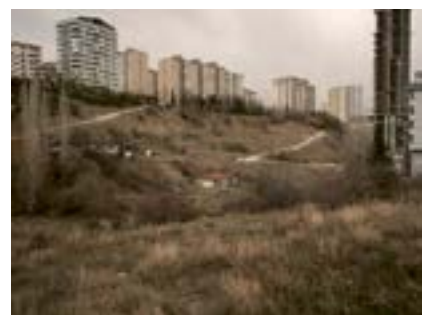
Büyükesat Vadisi, Ankara, 2022