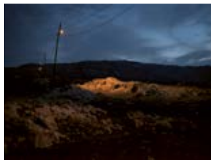
Çüngüş'te Gece, Güneydoğu Anadolu, 2021

1915'te Çüngüş ve çevresinde yaşayan 10.000 kadar Ermeni, Düden kuyusuna atıldı. Katliam yerel Kürt halk tarafından anılıyor.