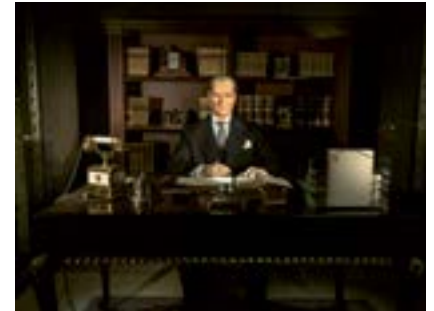
Cumhurbaşkanı Atatürk, Ankara, 2020

Anıtkabir İstiklal Müzesi içinde, makam sergisinin parçası olarak balmumu Atatürk figürü.