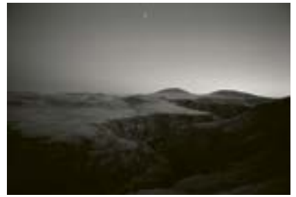
Ani, Vadi ve Sınır, Doğu Anadolu, 2018

Ani antik kentindeki Arpaçay (Ermenice: Akhuryan) nehri vadisi. Aynı zamanda Türkiye ile Ermenistan arasındaki sınırı çiziyor. Ufukta Ermeni sınır kulesi görülüyor.