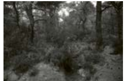
Gelibolu Siperleri, Türkiye, 2021

Gelibolu ormanlarında Birinci Dünya Savaşı siperleri girişi