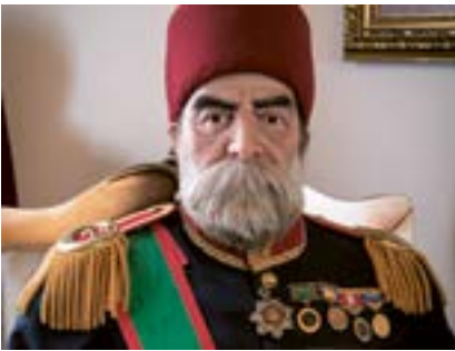
Gazi Osman Paşa, Kars, 2018

Kars'ta tarihî bir evde balmumu figür. Gazi Osman Paşa, 1877-78 Rus-Türk savaşında Osmanlı ordusunun komutanlarından biriydi.