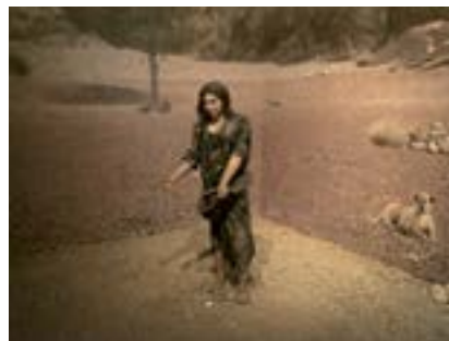
Mezopotamyalı Kadın, Şanlıurfa, 2022

Şanlıurfa Arkeoloji Müzesi'nde Mezopotamyalı kadın figürlü tarihöncesi tarım sergisi.