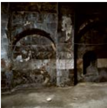
Yedi Kilise, Doğu Anadolu, 2018

Varagavank'ı (Yedi Kilise) Vaspurakan Kralı Senekerim-Hovhannes'in hükümdarlığının başlarında (1003-