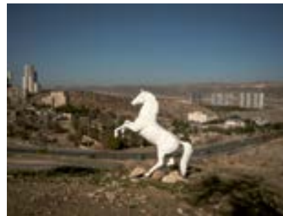
Mardin Atı, Güneydoğu Anadolu, 2021