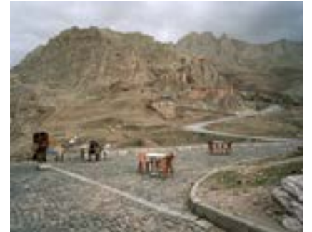
Doğubayazıt, Doğu Anadolu, 2018

Uzun bir geçmişe sahip Doğubayazıt, zaman zaman bağlı olduğu Ağrı'dan daha önemli bir merkez olmuştur. M.Ö 7.-8. yüzyıllardan itibaren Urartu İmparatorluğu'nun bir parçası olan kentte Urartulardan kalma bir kale var. Ermenice bu yerin adı Daruynk' veya Taruynk' idi. Urartu'dan sonra burada Persler, Romalılar, Araplar, Ermeniler ve Bizanslılar hüküm sürmüştü. Hepsi dağlara çıkmadan önce Doğubayazıt ovasını dinlenme ve konaklama yeri olarak kullanmışlar. 11. yüzyıldan itibaren Türkler ve Moğollar hüküm sürmüş, 1514'te Osmanlı İmparatorluğu'na geçmiştir. 19. yüzyılda, defalarca Rus ve Osmanlı İmparatorluğu arasında bir savaş alanı olmuş. Birinci Dünya Savaşı ve Kurtuluş Savaşı sırasında iyice harap edilmiş. Geniş bir alana yayılmış Bayazıt köyü, aslen bir Ermeni yerleşimiydi. 1930'da Kürtler ve Serhat bölgesinden Yezidiler yerleşti. Ardından Ağrı Ayaklanmaları'nın bastırılması sırasında Türk ordusu tarafından yok edildi.