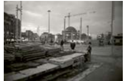
Taksim, İstanbul, 2018

Cami şantiyesinin Gezi Parkıճndan görünümü. Gezi Parkıճnın ön planda görülen basamaklarının ve park duvarlarının, 1560ճtan 1930ճa kadar orada bulunan, daha sonra istimlak edilerek düzlenen Pangaltı Ermeni Mezarlığıճna ait olduğu söyleniyor. Mezarlıktan çıkarılan taşlar, parkın çeşme ve basamakları için kullanılmış. Ruhlar huzur bulmuyor. 2013ճteki Gezi protestolarından bu yana Taksimճde polisten geçilmiyor.