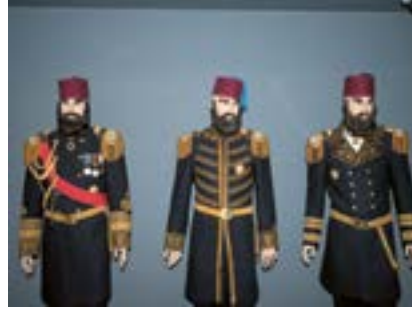
Osmanlı Donanması Amiralleri, İstanbul, 2022

İstanbul Deniz Müzesi'nde 19. yüzyıl Osmanlı Donanması'ndan amiral figürleriyle sunum.