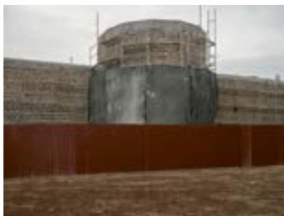
Tarihî Sur Restorasyonu, Diyarbakır, 2021

Diyarbakır surları, Romalılara kadar uzanan uzun bir geçmişe sahiptir. Büyük ölçüde bozulmamış durumdaki surlar eski şehri 5 km'den fazla uzunlukta çevreliyor. Duvarlar 10 metreden yüksek ve 3-5 metre kalınlığında. Tarihî Sur'un 2015/16'daki silahlı çatışmalarla yerle bir edilmesinin ardından her yerde yeni inşaat, yeniden inşa veya restorasyon yapılıyor.