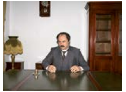
Ziya Gökalp, Diyarbakır, 2021

Ziya Gökalp (1876, Diyarbakır) yazar ve aydın. Türk Milliyetçiliği ve Turancılığın başlıca düşünür ve ideologlarından biri oldu, fikirleri İttihat ve Terakki'yi güçlü bir şekilde etkiledi. İrksal ve kültürel olarak homojen ulus fikrini başlattı.