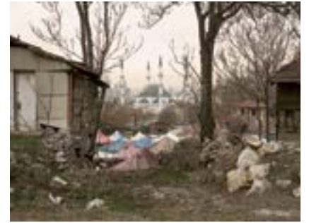
Ulus, Ankara, 2021

Ulus başkentin merkezinde bir mahalledir. Bir zamanlar Ankara'nın kalbi imiş. Şehrin Angora ismiyle anıldığı Roma döneminden kalma birçok kalıntı Ulus'tadır.