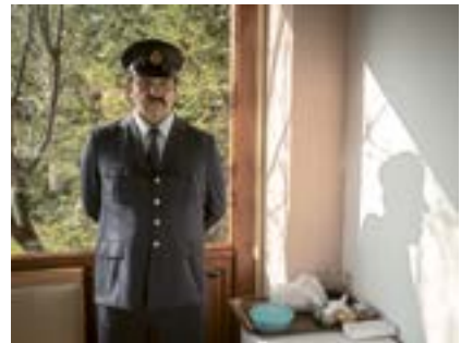
Ulucanlar Cezaevi Gardiyan, Ankara, 2020

Bir hapishane gardiyanının balmumu figürü. Ulucanlar Cezaevi, 1925 yılında Ankara'da kurulmuş, 2011 yılında müzeye çevrilmiştir. Hapishane çok sayıda isyan ve infazın yanı sıra işkence ve kötü muameleye de sahne olmuştur. Tutukluları arasında ünlü şair Nazım Hikmet'in yanı sıra çok sayıda sanatçı, sinemacı, siyasetçi ve insan hakları aktivisti vardı.