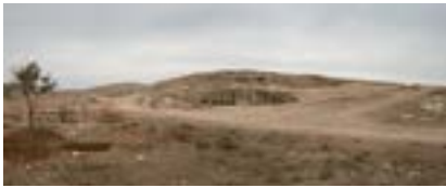
Dara Nekropolü, Güneydoğu Anadolu, 2021

Dara, Kuzey Mezopotamya'da Sasani İmparatorluğu sınırında önemli bir Doğu Roma kale şehriydi. Stratejik önemi nedeniyle, Roma-Pers çatışmalarında belirgin rol oynadı. Fotoğraf, taş ocağının ve Roma nekropolünün bir bölümünü gösteriyor. 1915'te Dara, Diyarbakır, Mardin ve Erzurum'dan tehcir edilen Ermenilerin (muhtemelen Süryanilerin de) katledildiği yerlerden biriydi.