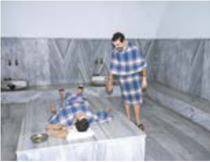
Hamam, İstanbul, 2021

Harbiye Askerî Müzesi'nde bir hamam sunumu.