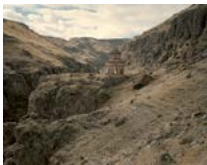
Khtzkonk, Doğu Anadolu, 2018

“Beşkilise” olarak da bilinen Khtzkonk Manastırı, Ani'nin yaklaşık 25 km güneybatısında ve Kars'a yakın bir vadide, üç kaya çıkıntısı üzerine yayılıyordu. Manastırın Surp Karapet, Surp Asdvadzadzin, Surp Stephanos, Surp Kevork ve Surp Sargis olmak üzere toplam beş kilisesi vardı. Bugün sadece Surp Sargis kilisesi ayakta. Manastırın