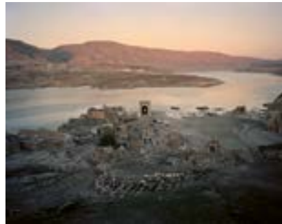
Hasankeyf, Güneydoğu Anadolu, 2021

Ilisu Barajı birçok protestoya rağmen tamamlandı ve tarihî Hasankeyf 2020 yılında Dicle'nin suları altında kaldı. Kentin on bin yılı aşkın geçmişinden kültür hazineleriyle birlikte. Hasankeyf'in kültürel anıtları gibi yaşayan halk da, Dicle'nin diğer yakasında, baraj gölünün yukarısında özel olarak inşa edilmiş yeni bir kasabaya ve "arkeoloji parkı"na yerleştirildi. Hasankeyf ile birlikte 200'e yakın köy ve mezra sular altında kaldı. Ermeni soykırımına kadar Hasankeyf'in bu köylerinde çoğunlukla Süryaniler ve Ermeniler yaşıyordu. Haziran 1915'te kentte hiç Hıristiyan kalmamıştı.