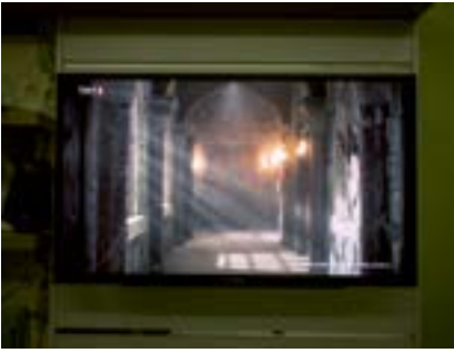
TV'de Büyük Selçuklu, Konya'da Otel odası, 2021

«Մեծ Սելճուկեան»ը հեռատեսիլով, Զօհիա հիւրանոցի մը սենեակին մէջ, 2021