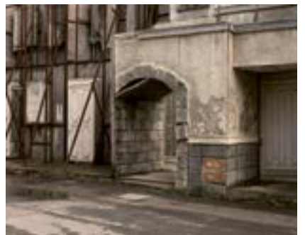
Tarihî Film Seti, İstanbul, 2020 Պատմական Ժապաւենի հարթակ, Իսթանպուլ, 2020