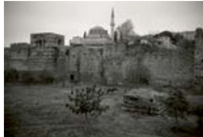
Bizans Kara Surları, İstanbul, 2020

Bizans kara surlarının Blakhernai Surları olarak adlandırılan bölümü.