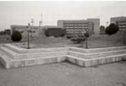
Լցճիրճա Նուհճւն Գեմիսի, Դոցու Անադոլու, 2018

Birinci Dünya Savaşı sırasında İğdırճa Türklere yönelik Ermeni katliam ve zulmünü anmayı amaçladığı söylenen ve 1999ճa açılan "İğdir Soykırım Anıtı ve Müzesi"nin hemen yanında, yeni imar mahallesi parkındaki Nuhճun Gemisi replikası. Efsaneye göre Nuhճun Gemisi tufandan sonra, İğdir yakınlarındaki Ağrı Dağıճnda mahsur kalmıştır.