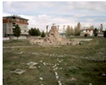
Anıt Tabanı ya da Oyun Parkı?, Kars, 2018

Kars'ta bir kaya replikası; yapılacak olan ya da yıkılmış bir anıtın tabanı mı, yoksa henüz tamamlanmamış bir oyun parkının unsuru mu belli değil.