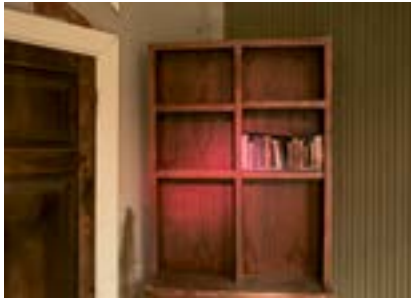
Bir Film Setinde Kitaplık, İstanbul, 2020

Ժապաւենի հարթակի մը մէջ գրադարան, Իսթանպուլ, 2020