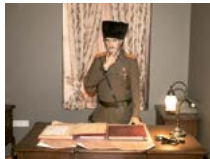
Askerî Komutan Atatürk, Diyarbakır, 2021

Kurtuluş Savaşı'nda Diyarbakır kalesinde bulunan karargâhı içinde balmumu Atatürk figürü.