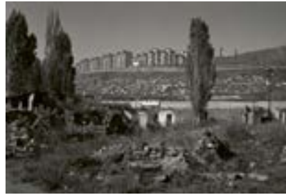
Kars Mezarlığı, Doğu Anadolu, 2018