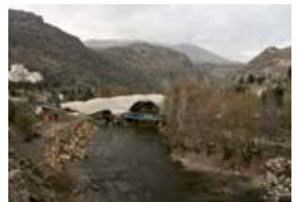
Çermik Vadisi, Güneydoğu Anadolu, 2021

13. yüzyıl Artuklu döneminden kalma, restorasyondaki Haburman Köprüsü'nün bulunduğu Çermik Vadisi. "Türk milliyetçiliğinin babası" olarak bilinen Ziya Gökalp'in baba tarafından ailesi aslen Çermiklidir.